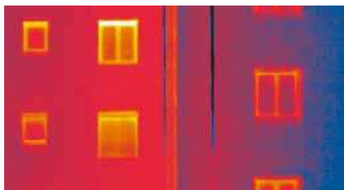
Setzen Sie dem Energieverlust eine klare Grenze: mit einer professionellen Wärmedämmung von Sto.

Mit einer Wärmedämmung leisten Sie einen effektiven Beitrag zum Umweltschutz. Denn weniger Energieverbrauch bedeutet weniger CO 2 -Belastung.