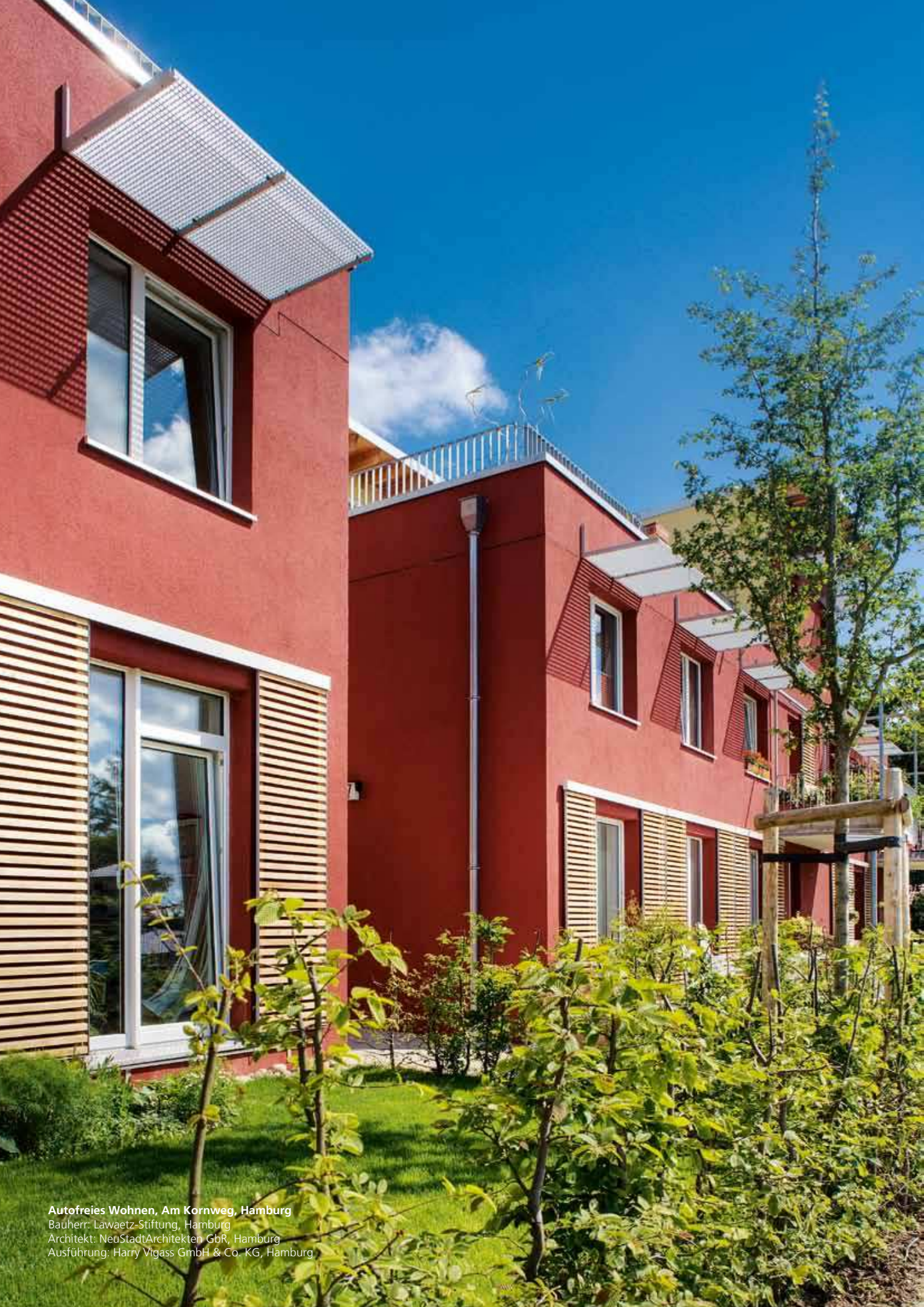
Autofreies Wohnen, Am Kornweg, Hamburg Bauherr: Lawaetz-Stiftung, Hamburg Architekt: NeuStadtArchitekten GbR, Hamburg Ausführung: Harry Vigass GmbH & Co. KG, Hamburg